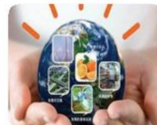
智慧地球 Smart planet