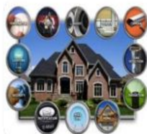
智能家居 Smart household