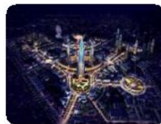
智慧城市 Smart city