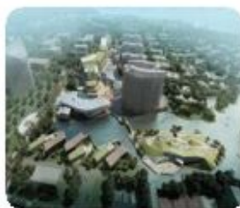
智慧社区 Smart Community